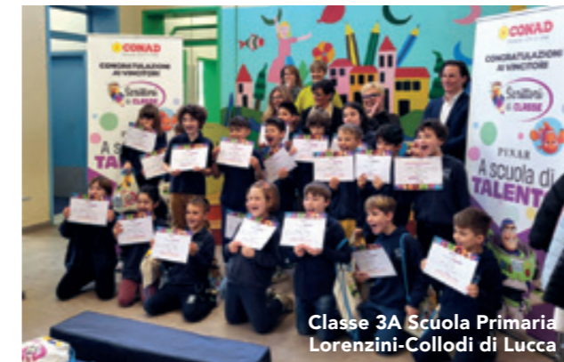
Classe 3A Scuola Primaria Lorenzini-Collodi di Lucca