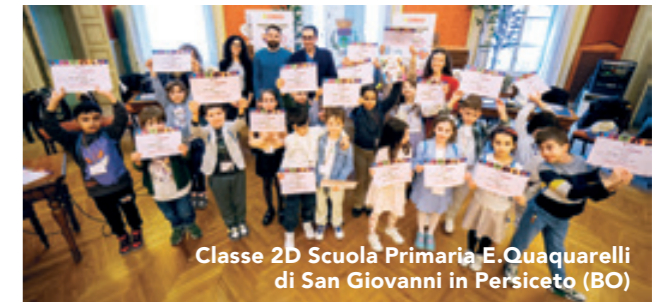
Classe 2D Scuola Primaria E. Quaquarelli di San Giovanni in Persiceto (BO)

Classe è il progetto cardine dell'iniziativa "Insieme per la scuola", programma dedicato a supportare e arricchire le scuole e le loro aule con strumenti educativi di qualità: dal 2012, grazie al contributo dei clienti, è stato possibile donare alle scuole 380mila premi tra attrezzature informatiche, multimediali e materiali didattici per un valore di oltre 45milioni di euro.