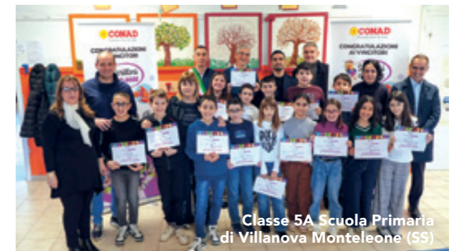
Classe 5A Scuola Primaria di Villanova Monteleone (SS)