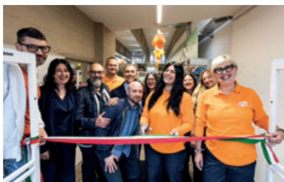
Carrara - Via Carriona Ang. Via Cavour